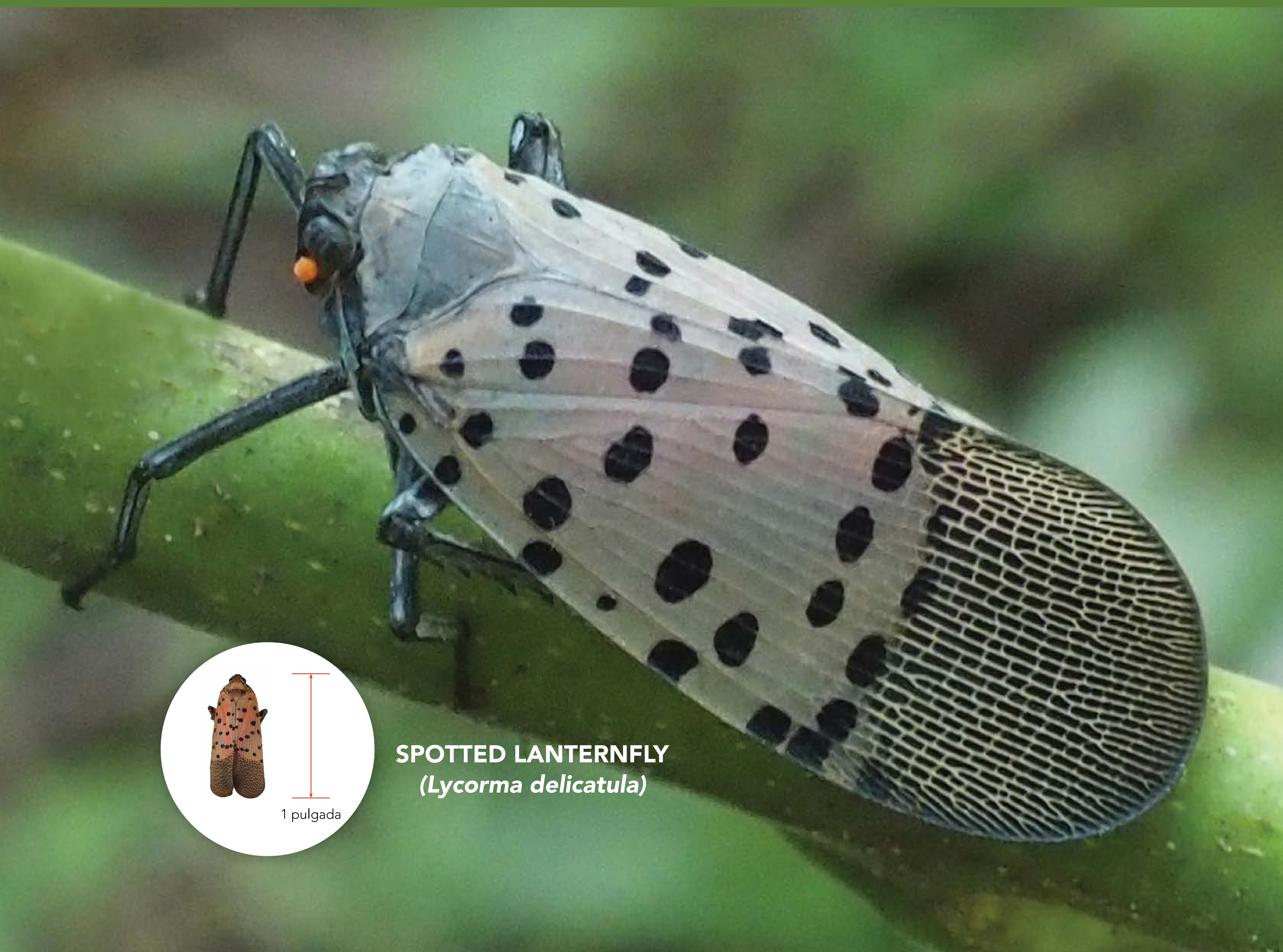
SPOTTED LANTERNFLY ( Lycorma delicatula )

Línea para Reportar Plagas del CDFA: 1-800-491-1899