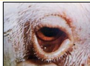
Conjuntivitis y edema de los párpados

Para reportar un número inusual de aves enfermas ó muertas, llame a la Línea Telefónica Estatal de Aves Enfermas: (866) 922-2473