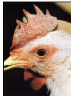
Pollo con apariencia normal con la cresta pálida