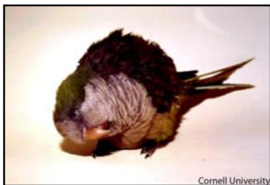
Cabeza y cuello torcidos

Signos clínicos: Dependiendo de la especie, edad, inmunidad, resistencia natural y virulencia de la cepa, puede haber una variación considerable en la severidad de los signos clínicos. Ciertas especies muestran un período de depresión, diarrea y pérdida de apetito. Los signos clínicos son más pronunciados en aves susceptibles. El edema de los tejidos alrededor del ojo, especialmente en el párpado inferior es común. Un líquido de color amarillo puede fluir por el pico y orificios nasales. Las dificultades respiratorias pueden variar de leves a severas. Los signos clínicos en pavos y en aves de mascota son usualmente leves. Entre 10 a 20 días después del inicio de los signos clínicos es común observar síntomas neurológicos, como cabeza y cuello torcidos (torticollis) y parálisis en las alas y/o patas.